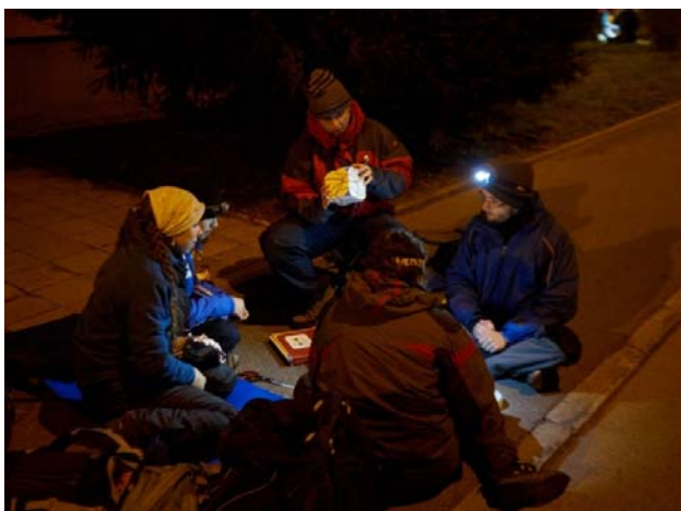
Jeden z týmů během luštění šifry.