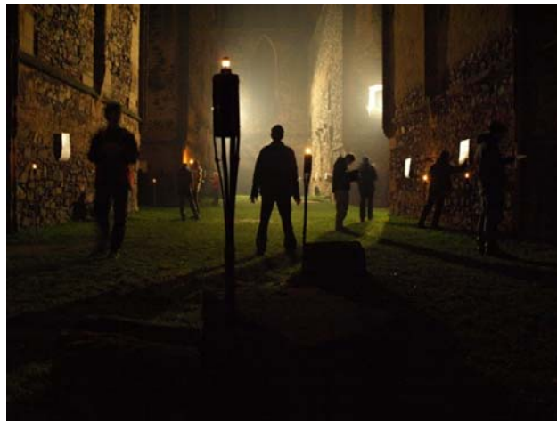
Během celé noci navštívilo klášter Rosa coeli přes tisíc hráčů. Hráči si prostory kláštera prohlíželi v úplné tichosti, aby dodrželi pietu místa.